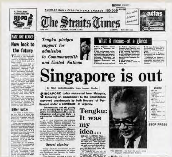
த ஸ்ட்ரெய்ட்ஸ் டைம்ஸ் 10 ஆகஸ்ட் 1965

1955-ஆம் ஆண்டில் நடந்த ஹாக் லீ பேருந்து கலவரம், சிங்கப்பூர் வரலாற்றில் நடந்த ஆகக் கொடுமையான கலவரங்களில் ஒன்றாகக் கருதப்படுகிறது. பேருந்து ஊழியர்களுக்கும் ஹாக் லீ ஒருங்கிணைந்த பேருந்து நிறுவனத்தின் நிர்வாகத்தினருக்கும் இடையிலான சர்ச்சையால் கலவரம் மூண்டது. கலவரத்திற்கான காரணம் குறித்து உள்ளூர் செய்தித்தாட்கள் மாறுபட்ட கருத்துகளைக் கொண்டிருந்தன. கலவரத்தை கம்யூனிஸ்ட் ஆதரவாளர்கள் தூண்டியதாக ஆங்கிலச் செய்தித்தாள் கைகாட்டியது. ஊழியர்கள் மோசமாக நடத்தப்பட்டதும், காவல்துறையினர் செய்த கொடுமையும் கலவரத்திற்கான காரணங்கள் என சீன செய்தித்தாள் குறிப்பிட்டது.