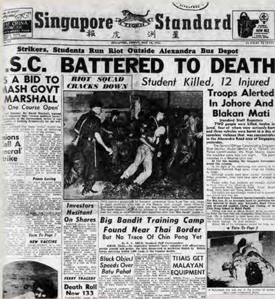
சிங்கப்பூர் ஸ்டாண்டர்ட் 13 மே 1955

கம்யூனிஸ்ட் கிளர்ச்சியா அல்லது தொழில்துறை சர்ச்சையா? ஹாக் லீ பேருந்து கலவரம்